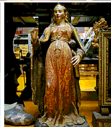
Nella foto in alto e in basso a sinistra, corsi di pittura e disegno; in basso a destra, la Vergine del XV secolo di Norcia danneggiata dal sisma, ora in mostra alla Casa Museo di via Gesù